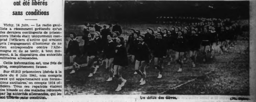
Un défilé des élèves.

WETLANDT, Oberst. u. Kommandant. 11 Juni 1941.