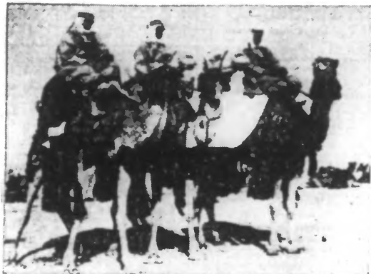
Un détachement de méharistes en patrouille dans le désert.

Le long de la côte du Liban, l'avance anglaise n'a été que de vingt kilomètres en quatre jours