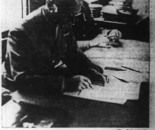
Le général Hutzinger signant l'acte préliminaire.