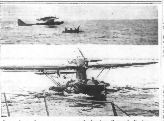
Deux phases du sauvetage, par un hydravion allemand, d'aviateurs tombés en pleine mer.

Paris, 21 juin. — La délégation générale du gouvernement français dans les territoires occupés annonce que 2.500 réfugiés environ, originaires de la région parisienne, seront rapatriés de zone non occupée en zone occupée, au cours de la semaine prochaine. Un train spécial rapatriant des personnes réfugiées dans la Haute-Garonne et dans la Haute-Vienne arrivera à Paris, à la gare d'Austerlitz, lundi soir. Le mardi 24 juin arriveront des réfugiés des Alpes-Maritimes ; le mercredi 25, des réfugiés de la Drôme ; le jeudi 26, des réfugiés du Rhône.