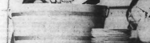
« — Au moins, fais-tu bien ton travail ? »