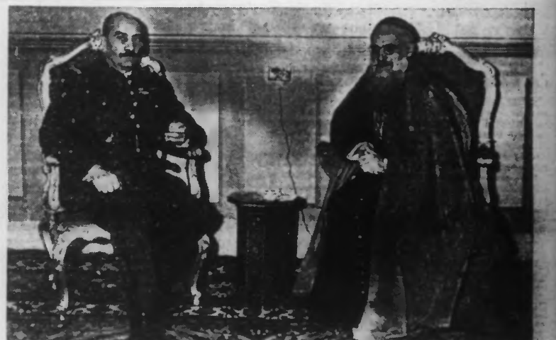
Le général Dentz et le cardinal Taponi, photographiés au cours de leur récente entrevue.

La Royal Air Force a bombardé le port de Beyrouth au cours de la nuit du 21 au 22 et dans la matinée du 22, ne causant aucun dégât important, mais faisant plusieurs victimes parmi la population civile.