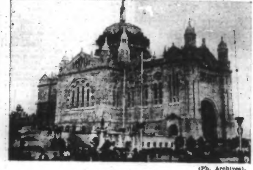
La basilique de Lisieux.