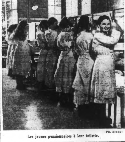
Les jeunes pensionnaires à leur toilette.

La Maison de la Légion d'honneur est rentrée au château d'Ecouen... Paris, 8 juillet. — La Maison de la Légion d'honneur est rentrée au château d'Ecouen.