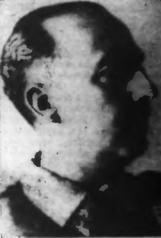
Le général Franco

Le Caudillo a constaté que l'Europe n'avait pas d'ambitions en Amérique et que le continent amé-