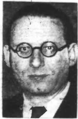
M. Pierre Pucheu

ministre de l'Intérieur M. Lehideux secrétaire d'Etat à la Production industrielle