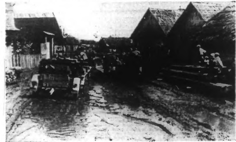
Ce bourbier est une route soviétique de premier ordre !

Dans tous les secteurs du front oriental des opérations formidables se déroulent en notre faveur. Dans la lutte contre la Grande-Bretagne, l'armée aérienne allemande, opérant avec de forts contingents, a bombardé, une fois de plus, au cours de la nuit de jeudi à vendredi, des entrepôts, des magasins de céréales, des raffineries de pétrole et des docks dans le port de ravitaillement de Hull. De vastes incendies, et de violentes explosions ont été provoqués. D'autres avions de combat ont coulé, au large de la côte orientale britannique, un cargo de 3.000 tonnes, endommagé deux autres grands navires marchands et attaqué efficacement des aérodromes des Midlands. En vue du littoral de l'Afrique du Nord, près de Sid-el-Barani, des « Stukas » et des « Piv-chiatelli » ont coulé, le 15 juillet, un grand navire marchand et en ont touché, sérieusement un autre. Cinq avions britanniques ont été abattus en combats aériens. Au cours de tentatives d'avions de combat et de chasse d'attaquer jeudi la côte de la Manche, des chasseurs allemands et la D. C. A. ont descendu dix appareils. Dans la Manche, des dragueurs de mines ont abattu quatre avions britanniques. Dans la nuit de jeudi à vendredi, des avions de combat anglais ont jeté quelques bombes explosives et incendiaires sur l'Allemagne occidentale, sans résultats notables. Des chasseurs nocturnes et la D. C. A. ont descendu trois des avions ennemis.