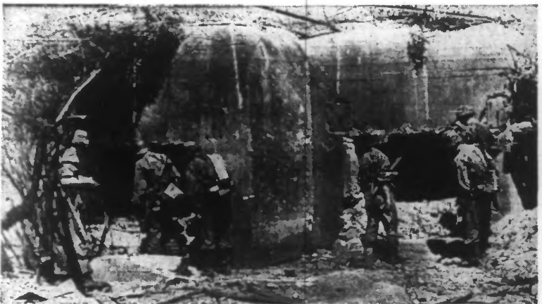
Un fortin de la ligne Staline conquis par les troupes allemandes.

Stockholm, 20 juillet. — Radio-Moscou annonce que Staline a été nommé commissaire du peuple pour la défense.