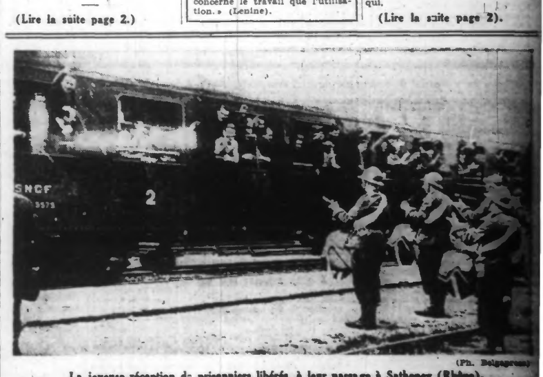
La joyeuse réception de prisonniers libérés, à leur passage à Sathonay (Rhône).