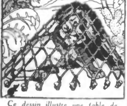
Ce dessin illustre une fable de La Fontaine, Laquelle ?