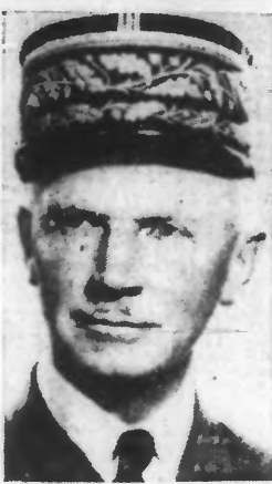
Le général Huntziger

« RIEN N'EST PERDU quand l'honneur est sauf... »