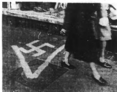
Le V symbolisant les victoires allemandes a été tracé sur le sol.

QUARTIER GÉNÉRAL DU FUHRER, 24 JUILLET. — Le haut commandement des forces armées communique : « Sur tout le front oriental, les opérations des forces armées allemandes et de leurs alliés se déroulent avec le plus grand succès. Les troupes allemandes, maîtres de fortes résistances locales, et en dépit des difficultés que présentent les routes, ont accompli de remarquables succès. Au cours de la nuit de mercredi à jeudi, de forts contingents d'avions de combat ont attaqué une nouvelle fois, au moyen de bombes de tous calibres, des objectifs militaires et d'importance capitale de la ville de Moscou. Mercredi, l'aviation britannique a connu une de ses plus sévères défaites en tentant d'attaquer le littoral de la Manche. Des chasseurs ont abattu quarante-six avions anglais, la D.C.A. trois, des patrouilles, leurs trois, et l'artillerie de la marine deux. L'ennemi a perdu ainsi, en l'espace de quelques heures, cinquante-quatre appareils. Au cours de ces combats nous avons perdu trois avions. Dans la lutte contre la Grande-Bretagne, l'aviation a bombardé au cours de la nuit de mercredi à jeudi des ports et des objectifs militaires de la côte occidentale et orientale de l'île anglaise. Des avions de combat britanniques ont jeté des bombes explosives et incendiaires sur quelques localités du sud-ouest de l'Allemagne. Les pertes parmi la population civile sont minimes. Les dégâts sont insignifiants. »