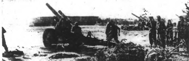
L'artillerie allemande à l'assaut des fortifications de la ligne Staline.

Cent onze avions soviétiques ont été détruits le 23 juillet