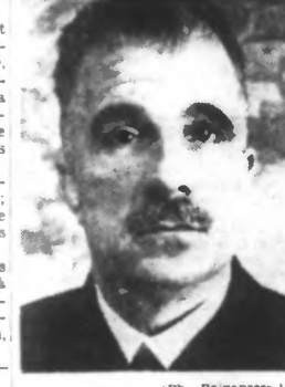
Le vice-amiral Gouton qui vient d'être nommé commissaire général du pouvoir