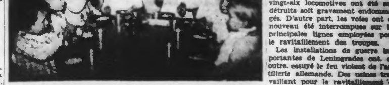
A Paris, 400.000 repas chauds seront servis chaque jour cet hiver dans les cantines scolaires, grâce au Secours national. Voici le réfectoire d'une école maternelle du XI e arrondissement.

Berlin, 16 novembre. — Samedi, de fortes unités de l'aviation allemande ont attaqué des gares, des installations ferroviaires, des trains et des ponts ainsi que des voies de communications et des installations industrielles.