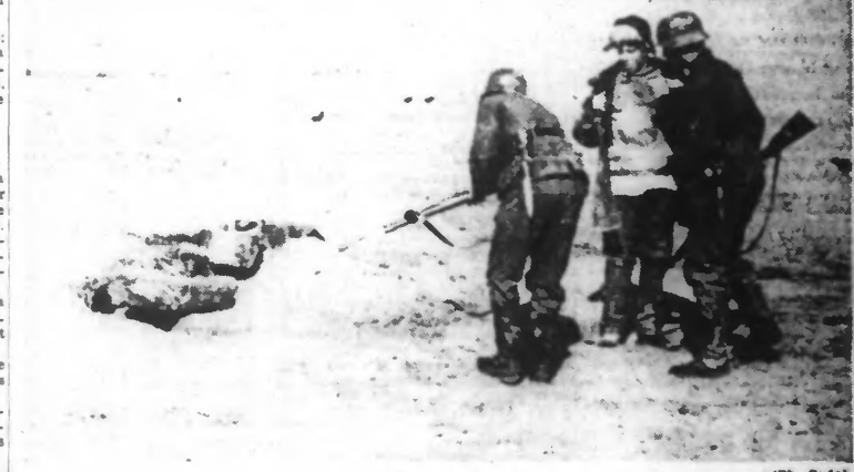
Un franc-tireur soviétique capturé par les soldats allemands qui l'ont fait sortir de sa véritable tanière.

Près de Tichvin, deux compagnies du génie s'emparent, à elles seules, de 113 nids de résistance