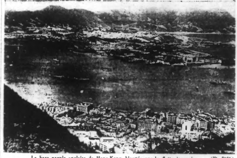
La base navale anglaise de Hong-Kong, bloquée par la flotte japonaise.

TOKIO, 10 DÉCEMBRE. — Le quartier général impérial communique : « L'aviation maritime japonaise a coulé les deux cuirassés britanniques Repulse et Prince of Wales à proximité de la presqu'île de Malacca. » Selon l'agence Domei, la flotte britannique de l'Extrême-Orient a été repérée mercredi, vers 11 h. 30 (heure japonaise), près de la côte malayenne. Aussitôt, les avions japonais sont entrés en action. Le Repulse a aussitôt été coulé par des bombes. Le Prince of Wales a été atteint à bord vers 14 h. 29. Il a tenté de s'échapper, mais à 14 h. 50 il essayait d'autres coups et coulait à son tour. Le « Prince of Wales » était le plus moderne des cuirassés britanniques. Il était arrivé il y a quelques semaines à Singapour. Nankin, 10 décembre. — Le porte-parole de l'armée japonaise a annoncé que la ville de Hong-Kong était encerclée sur terre et par mer. Il a déclaré, en outre, que les troupes japonaises qui ont débarqué lundi dans le Sud de la Thaïlande ont commencé leur offensive en direction de Singapour. Le porte-parole de la flotte japonaise a confirmé que les îles Wake et Guam ont été occupées par les Japonais et que les îles Midway se trouvent sous le feu des navires de guerre nippons. Tokio, 9 décembre. — Les troupes nippones sont entrées à Bangkok, capitale du Siam, le 8 décembre, à 21 heures.