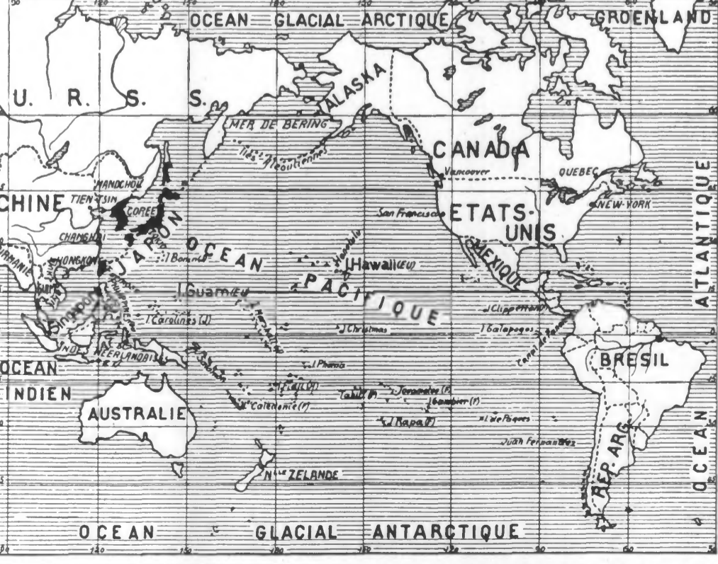
(Service cartographique du JOURNAL DE ROUBAIX.) (L'île de Wake est située approximativement à la pointe droite inférieure de l'océan Pacifique.)

QUARTIER GÉNÉRAL DU FÜHRER, 9 DÉCEMBRE. — Le haut commandement de l'armée communique : Sur le front de l'Est, opérations locales. Dans sa lutte contre la navigation et de ravitaillement anglaise, l'aviation allemande a coulé lundi, dans les eaux à l'est de Dundee, un destroyer et quatre navires de commerce naviguant en convoi et totalisant 14.000 tonnes. Au cours de la nuit de lundi à mardi, des avions de combat ont bombardé la ville de Newcastle, importante pour ses constructions navales. Des explosions violentes et des incendies étendus dans les docks et les installations de ravitaillement de la ville ont permis d'observer le résultat de cette attaque exécutée en partie à basse altitude. Sur la côte de la Manche, l'ennemi a perdu, lundi, dix avions abattus par nos chasseurs, et deux descendus par l'artillerie de marine. En Afrique du Nord, les combats continuent. Des chasseurs allemands ont abattu six avions anglais. Dans la nuit du 7 au 8 décembre, des installations portuaires et des champs d'aviation de l'île de Malte ont été bombardés par des avions allemands.