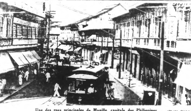
Une des rues principales de Manille, capitale des Philippines.

Grenoble, 13 décembre. — Un convoi de sept quarante prisonniers revenant d'Italie est passé en gare de Saint-Jean-de-Maurienne. Les honneurs militaires lui avaient été rendus à Modane.