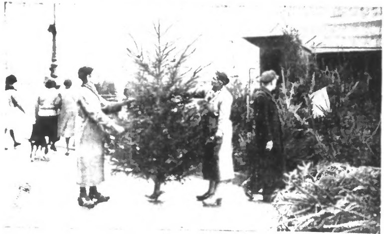
Les sapins de Noël ont fait leur apparition au marché aux fleurs, à Paris.