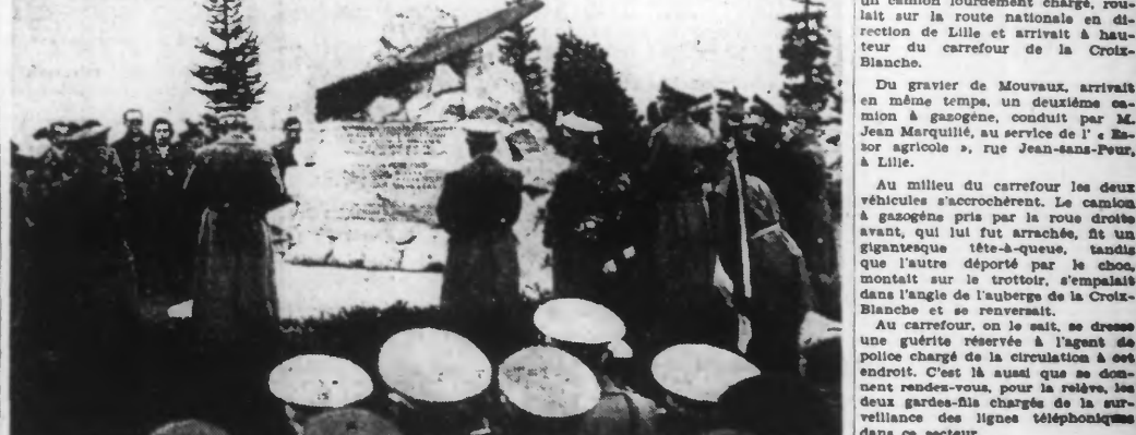
Les membres de la commission d'armistice franco-italienne devant le monument élevé, à Cartosio, à la mémoire du général Pinto de Fellegri.

L'aviation anglaise a, au cours de ces dernières vingt-quatre heures, lors de survols de la région de la Manche, perdu au total douze appareils.