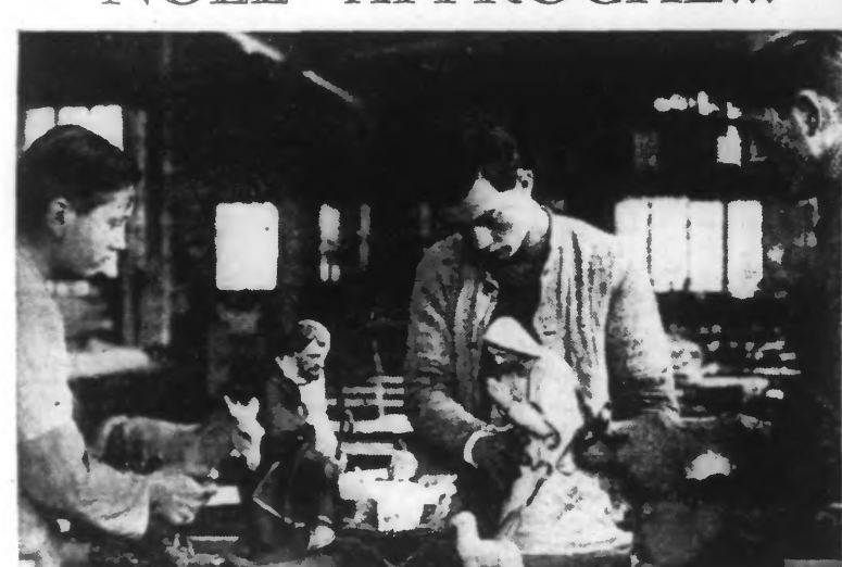
Les apprentis d'Auteuil commencent à préparer leur célèbre arche avec les personnages légendaires.