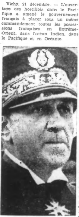
L'amiral Decoux

gouverneur de l'Indochine est nommé haut-commissaire pour les possessions françaises dans le Pacifique