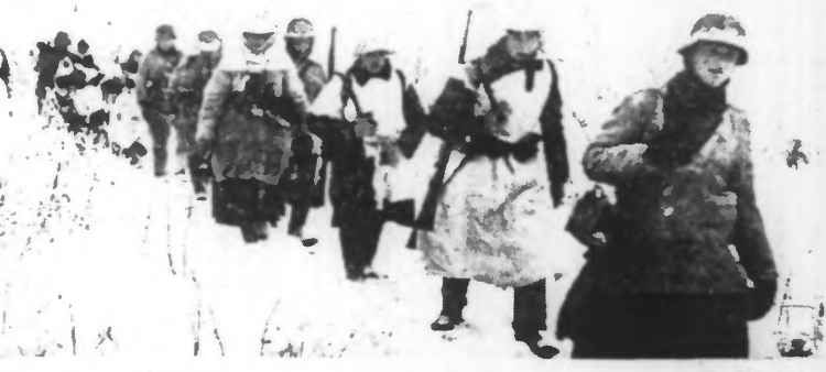
Une patrouille de tirailleurs allemands chargée de combattre les franc-tireurs soviétiques.

En 1943, les Anglais et les Américains seront prêts... assure M. Churchill « En attendant, ils ont encore beaucoup à apprendre » Stockholm, 26 décembre. — M. Winston Churchill a prononcé vendredi devant le Sénat et le Parlement des Etats-Unis un discours en faveur de la situation militaire en Europe. Il a signalé entre autres que les Anglais ne se font pas illusion quant aux dures épreuves que les attendent encore. L'Amérique et les Etats-Unis ont encore beaucoup à apprendre et ne peuvent pas encore au bout de leurs combats, nous devons nous attendre à encore subir des pertes de terrain. (Lire la suite page 2.)