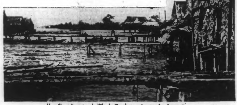
Un village lacustre de l'île de Tarakan, prise par les Japonais.

Une brillante performance britannique Stockholm, 13 janvier. — Le bureau anglais d'informations considère que la fuite des troupes anglaises de Kuala-Lumpur, constituée dans le domaine des transports, la plus brillante performance de l'histoire de cette campagne. Ces troupes auraient parcouru 80 kilomètres « en chantant et sans connaître le moindre incident ».