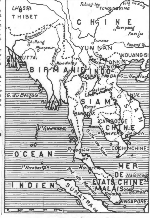
(Service cartographique du JOURNAL DE ROUBAIX.)

Le quartier général impérial japonais annonce que, lundi, des avions nippons ont bombardé à deux reprises et avec succès l'aérodrome de Singapour. Le communiqué ajoute que les installations de l'aérodrome de Tangah ont été détruites. Il confirme, en outre, que seize avions britanniques ont été abattus au cours de diverses incursions effectuées par les avions japonais. Parmi ces avions, dix du type « Buffalo » ont été détruits à Johore, cinq autres à Senentan, et un « Blenheim » au-dessus de Tangah. Tous les avions japonais sont rentrés indemnes à leur base.