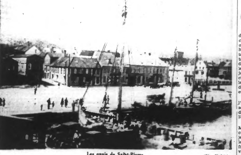
Les quais de Saint-Pierre.

Paris, 13 janvier. — Dans les milieux bien informés, on commente vivement une dépêche du correspondant du « Times » à Washington. Ce correspondant demande à son journal que les cabinets de Washington et de Londres se fassent fermement décidés à ne faire aucune difficulté à de Gaulle. Néanmoins, l'occupation de Saint-Pierre-et-Miquelon par l'ex-amiral Muselier est très désagréable au gouvernement américain, parce qu'elle a lieu au moment même où les Etats-Unis s'étaient mis d'accord avec les autres Etats américains pour ne pas tolérer de changements de souveraineté en Amérique. On croit savoir que les Etats-Unis et le Canada désirent prendre bientôt directement le contrôle de Saint-Pierre-et-Miquelon et que l'action des gaullistes a simplement préparé le terrain.