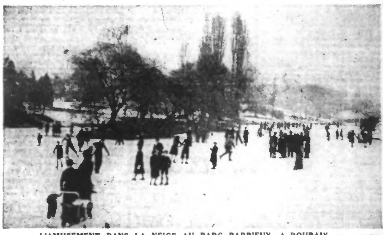
L'AMUSEMENT DANS LA NEIGE AU PARC BARBIEUX, A ROUBAIX

Berlin, 18 janvier. — Une convention militaire a été signée dimanche à Berlin, entre l'Allemagne, l'Italie et le Japon. Cet accord fixe les lignes directrices des opérations des trois pays contre les ennemis communs. Il a été signé pour l'Allemagne, par le chef du haut-commandement de la Wehrmacht; pour l'Italie, par un représentant du haut-commandement de l'armée italienne; pour le Japon, par un représentant du chef de l'état-major général de l'armée japonaise et par un représentant du chef de l'état-major général de la marine japonaise.