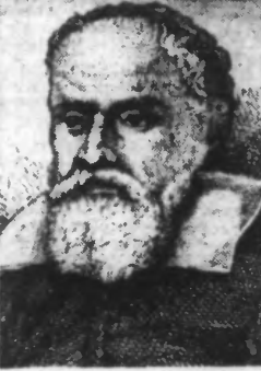
Le célèbre physicien Galilée découvrit le système de la gravitation planétaire et dont on va faire le troisième centenaire.