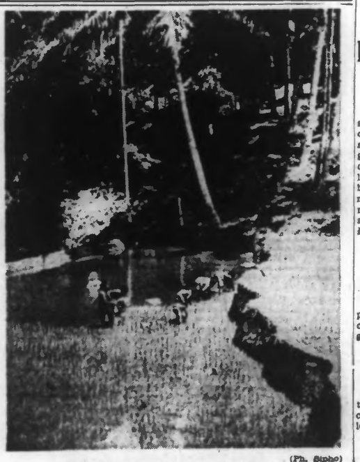
Une rizière dans les Indes néerlandaises.

Berlin, 18 janvier. — L'amirauté anglaise croit pouvoir démentir les communiqués militaires des puissances de l'Axe, relatives à la guerre navale, en faisant accroître, depuis les débuts des hostilités jusqu'à la date du 31 décembre 1941, les hauts commandements allemand et italien ont annoncé la perte d'unités navales anglaises dont le total s'élevait à : 44 vaisseaux de ligne, 20 porte-avions, 158 croiseurs, 183 destroyers, 96 sous-marins. A l'encontre de ces chiffres, on précise officiellement que le haut commandement allemand a signalé comme ayant été coulés : 2 vaisseaux de ligne, 4 porte-avions, 17 croiseurs, 63 destroyers, 47 sous-marins, tandis que, de son côté, le haut commandement italien a annoncé le torpillage des unités suivantes : Probablement 1 vaisseau de ligne, 11 croiseurs, 18 destroyers, 42 sous-marins.