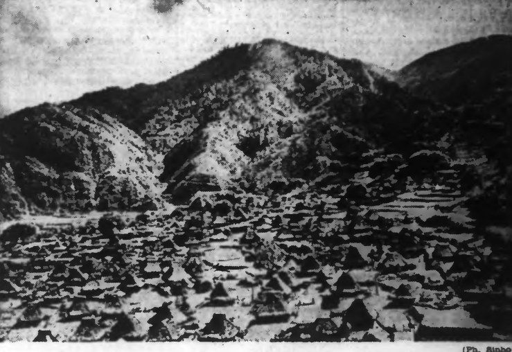
Un campement de forces américaines dans l'île de Lagon, avant leur acheminement.

Les défenses britanniques sur la côte occidentale ont été percées NOMBREUX INCENDIES À SINGAPOUR