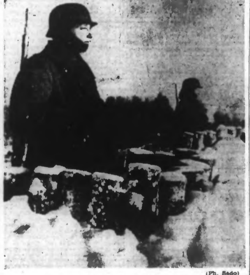
Un poste de garde dans la neige à l'Est