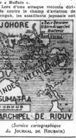
Service cartographique du JOURNAL DE ROUBAIX

Un combat décisif dans les environs de Johore-Baru Changhaï, 19 janvier. — Selon les dernières nouvelles parvenues du front de Malaisie, les troupes nippones ont atteint dimanche soir (heure japonaise) l'extrémité sud de la péninsule de Malacca. Les formations japonaises progressant de l'ouest et du nord en direction de Singapour ont opéré leur liaison dans la région de Johore-Baru, qui fait immédiatement face à l'île de Singapour. Il en résulte que les restes de l'armée britannique combattant sur la péninsule et se chiffrent à plus de 20.000 hommes se trouvent encerclés. Les communications ferroviaires et routières en direction de Singapour ont été coupées dans les environs de Johore-Baru. On admet qu'un combat décisif se produira dans la région de Johore-Baru étant donné que l'ad-