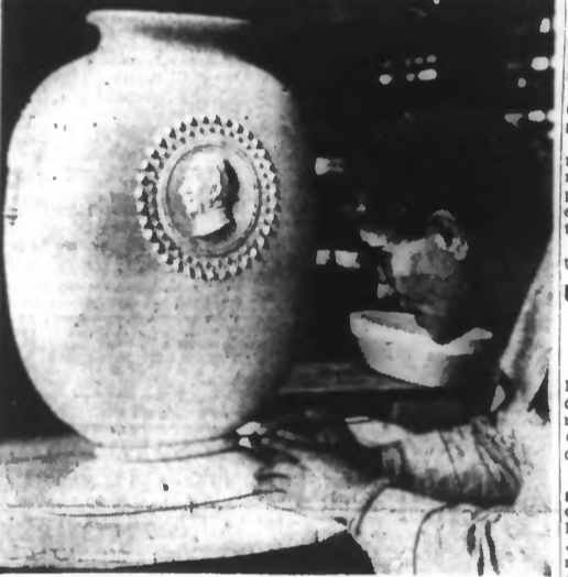
Un vase de Sevres va être offert prochainement au Maréchal par la manufacture. Un artiste en retouche le modèle en plâtre.

Vichy, 19 janvier. — A propos du congrès des salonniers, qui vient de se tenir à Vichy, le Journal de la Radiodiffusion française a donné l'esquisse de la façon dont se construiront les corporations, sur l'organisation corporative, telle qu'elle s'est développée ces derniers temps. Dès le 13 septembre 1940, le Maréchal soulignait la nécessité d'organiser la profession sur une base corporative. Le 4 octobre dernier, une loi était promulguée, à laquelle on a donné le nom de « Charte du travail ». On lisait dans le préambule de cette loi : « Les corporations restent le grand espoir de l'avenir français ». Voilà une affirmation longtemps atten-