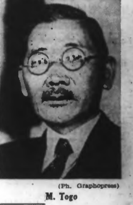
M. Togo

M. TOGO proclame sa foi dans l'instauration d'un ordre mondial nouveau par la victoire commune Tokio, 19 janvier. — Dans un discours radiophonique lundi à l'intention du peuple allemand, à l'occasion de l'échange des programmes germano-nippons, M. Togo, ministre des affaires étrangères, a exprimé ses sentiments d'admiration à l'égard de la nation allemande allée qui, depuis 1939, combat avec détermination l'ennemi dont le but constant a toujours été d'empêcher l'Allemagne de créer, en Europe, un nouvel ordre basé sur la justice. L'orateur a mis en évidence les brillants faits d'armes de l'armée allemande, qui ont permis d'éliminer en peu de temps toute l'influence anglaise du continent européen. « Le Japon, l'Allemagne et l'Italie, a-t-il poursuivi, ont conclu en septembre 1940 le pacte tripartite dans le dessein d'amener l'Angleterre et l'Amérique à se rendre compte de la nécessité absolue d'instaurer un ordre nouveau et juste dans le monde. » « Ces pays se sont non seulement mépris sur le sens des choses, mais ils ont, au contraire, renforcé leur hégémonie et l'ont même imposée par la force à d'autres peuples. Dans ces conditions, il ne nous restait d'autre choix que de prendre les armes pour protéger la justice; c'est ce que nous avons fait en décembre dernier. » « C'est à nous, nous japonais, dans le Pacifique, l'amiral Togo a ajouté : » (Lire la suite page 2.)