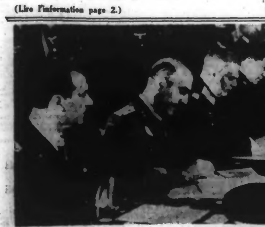
À Berlin a eu lieu la signature de la convention militaire entre l'Allemagne, l'Italie et le Japon.

Il a adressé un souvenir ému aux familles des victimes qu'il avait visitées l'an dernier sur les lieux de leur travail