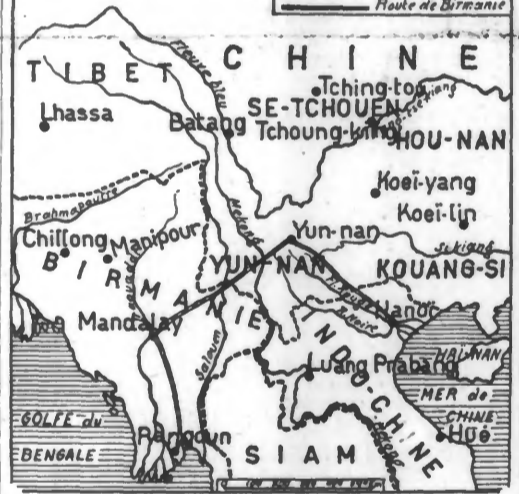
(Service cartographique du JOURNAL DE ROUBAIX.) La ville de Moulmein est située au sud-est de Rangoon, à l'endroit où, sur la carte ci-dessus, se trouve l'embouchure du Salween.

Tokio, 22 janvier. — On mande du front birman que les troupes nippones qui marchent sur Moulmein ont forcé à la retraite après des combats acharnés, 40.000 Anglais qui tentaient de s'opposer à leur progression.