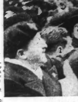
S. Em. le cardinal Gerlier, primat des Gaules, a quêté dans les rues de Lyon, pour le Secours national et la Croix-Rouge.