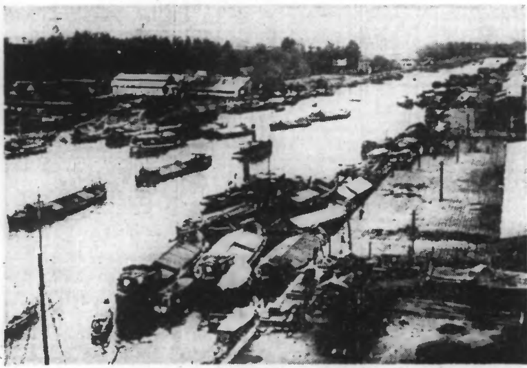
L'île de Java, possession hollandaise dans l'archipel de la Sonde, vient de subir de violentes attaques de la part de l'aviation japonaise. Voici une vue d'une ville de Java.