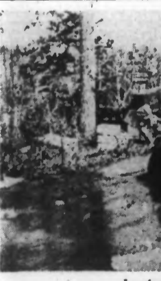
Le réveil printanier au « paradis » des Soviets.

Berlin, 7 mai. — Dans le secteur central du front de l'Est, les attaques allemandes ont été couronnées de nouveaux succès. Au cours de l'une d'elles, l'ennemi, après plusieurs jours de combat, a été obligé d'évacuer ses positions et a été re-