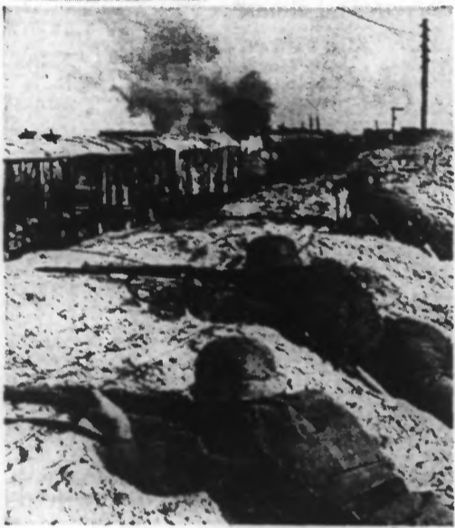
Un train russe est pris sous le feu de l'artillerie allemande et l'infanterie tire sur les hommes du convoi qui prennent la fuite.

Berlin, 17 mai. — Dans la presqu'île de Kertch, les soviétiques ont été encerclés par les troupes germano-russes sur un espace réduit... (Lire la suite page 2.)