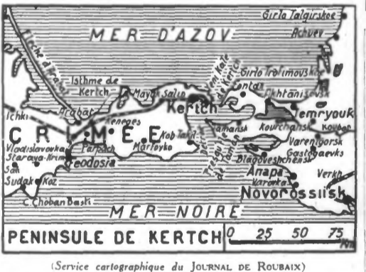
PENINSULE DE KERTCH 25 50 75 (Service cartographique du JOURNAL DE ROUBAIX)

M. PIERRE LAVAL est à Paris... Vichy, 17 mai. — M. Laval, chef du gouvernement, est parti dimanche pour Paris en vue d'y poursuivre ses négociations.