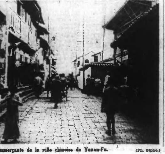
Une rue commerçante de la ville chinoise de Yunan-Fu.