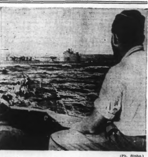
Deux sous-marins allemands se rencontrent dans l'Atlantique.