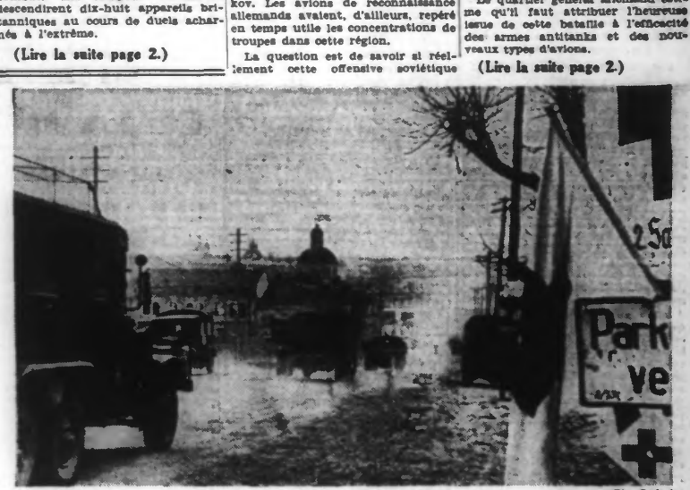
Les premiers contingents des troupes allemandes font leur entrée dans la ville de Kertch.