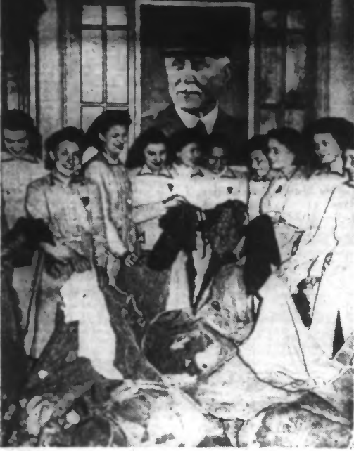
La collecte de tissus et de vêtements usagés pour les Nord-Africains a commencé à Paris sous l'égide du Secours national, avec le concours du secrétariat à la jeunesse. Voici des jeunes filles d'un pensionnat parisien avec leur première « récolte », dans un centre de ramassage parisien.