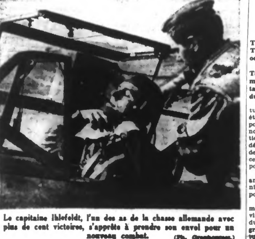
Le capitaine Hlofeldt, l'un des as de la chasse allemande avec plus de cent victoires, s'apprête à prendre son envol pour un nouveau combat.

Antakya, 6 juin. — On apprend aujourd'hui seulement que le 28 mai, une forte explosion, suivie d'un violent incendie, s'est produite dans la raffinerie de pétrole de Tripoli, en Syrie. Les autorités compétentes observent un silence absolu sur les causes de l'explosion qui a fait de nombreuses victimes.