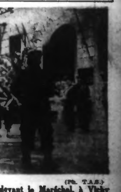
Musique en tête, le 150 e R.I. défile devant le Maréchal, à Vichy.

Vichy. — La Commission de réforme du code de procédure civile poursuit ses travaux. Au cours de sa dernière réunion au ministère de la Justice, elle a élaboré trois nouveaux textes de loi. Le premier règle les différentes questions que soulève l'application de l'article 119 du code de procédure civile concernant la comparution personnelle des parties, soit en audience publique, soit en chambre du conseil. Le second texte concerne l'exécution provisoire des jugements non définitifs qui, jusqu'ici, ne pouvait être ordonnée dans certains cas limitativement énumérés par la loi. L'exécution devait être provisoire, c'est-à-dire que le débiteur n'était pas tenu de payer le jugement en cas d'urgence ou de péril. L'exécution provisoire pourra être autorisée à la constitution d'une garantie fixée par le juge. Enfin, le troisième texte de loi concerne l'appel des décisions judiciaires. D'une façon générale, l'appel sera à seule fin de prolonger la procédure sera jugé rapidement et définitivement sanctionné, les délais seront suspendus par le décès de l'une ou de l'autre des parties.