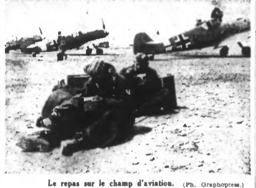
Le repas sur le champ d'aviation.

ROME, 6 JUIN. — Le quartier général de l'armée communique ce qui suit : Les opérations des forces de l'Axe en Marmarique continuent à se développer favorablement. De fortes unités ennemies, soutenues par de l'artillerie et des chars blindés de reconnaissance, ont essayé de nous repousser des positions que nous avions atteintes, ont été battues. Trente-six chars blindés et quelques dizaines de camions ont été détruits ; nous avons fait quelques centaines de prisonniers. Malgré des conditions atmosphériques défavorables, l'aviation a fait preuve d'une active coopération. Les appareils ennemis ont été abattus, six ont été contraints d'atterrir ; un avion a été atteint par la D.C.A. et s'est abattu en mer. Les deux sous-officiers qui occupaient ont été saisis et faits prisonniers. Un « Beaughliter » a tenté de survoler l'île de Lampédouse, Touché par la D.C.A. Il s'est abattu en mer. Les deux sous-officiers qui occupaient ont été saisis et faits prisonniers. Une attaque en plusieurs vagues entreprise dans la nuit de vendredi à samedi contre Naples et ses environs, par des avions anglais, a provoqué de légers dégâts. Quelques incendies ont pu être immédiatement éteints. Il y a un mort et un blessé parmi la population civile. L'attaque s'est portée ensuite sur les côtes de la province de Littoria, où des fusées ont été lancées.