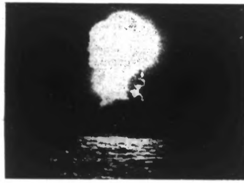
L'explosion d'un cargo frappé par une torpille.