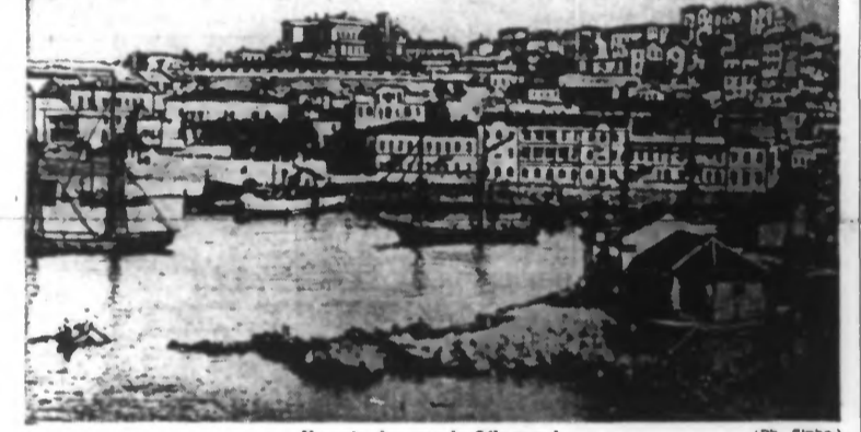
Un coin du port de Sébastopol.

Plus de mille camions chargés de munitions et de carburant ont été saisis, des trains blindés, qui voulaient arrêter l'avance des troupes allemandes et roumaines, ont été détruits par des coups directs.