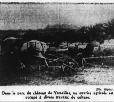
Dans le parc du château de Versailles, un ouvrier agricole est occupé à divers travaux de culture.