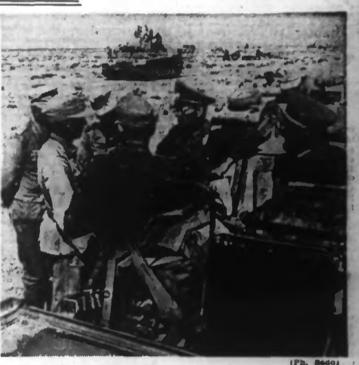
Le général von Bismarck donne des ordres pendant la bataille dans le désert.

canons. L'ennemi, sévèrement battu, était dispersé en plusieurs groupes qui furent en partie encerclés et décapés au sud-est de Marsa-Matrouk et en partie rejetés vers cette localité. A la faveur d'attaques effectuées par la 90 e division légère allemande, et un corps d'infanterie italienne, l'état autour de Marsa-Matrouk fut verrouillé et rétréci de plus en plus. Dans la nuit du 27 au 28 juin, l'ennemi entreprit plusieurs tentatives de dégagement ; au cours de ces opérations, les Britanniques subirent de lourdes pertes matérielles et humaines ainsi qu'un matériel de guerre. Le lendemain à l'aube, la forteresse fut prise d'assaut. La grande importance de Marsa-Matrouk ressort non seulement de sa situation naturelle particulièrement avantageuse, mais aussi du fait qu'elle est la première grande station située sur la route côtière qui mène à Alexandrie ; en outre, cette ville est en même temps le point de départ de la grande route du désert qui conduit à l'oasis de Siouah ainsi que celui d'autres routes de caravanes en direction du sud-est. L'aérodrome et le château d'eau caractérisent l'importance de cette place forte ; au surplus les Britanniques perdent en Marsa-Matrouk le principal port d'approvisionnement entre Soltum et Alexandrie. L'aviation allemande harcèle les Anglais en retraite La région d'Alexandrie bombardée Berlin, 29 juin. — Sur le front nord-africain, l'aviation allemande a continué à harceler les Britanniques en retraite. Dans la région de Fouka et à