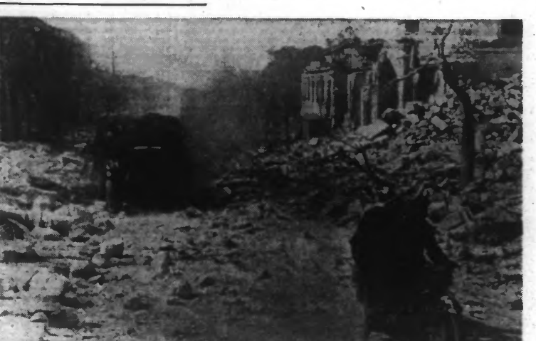
Malgré les ruines, les unités allemandes poursuivent l'ennemi en fuite dans les boucles du Don.