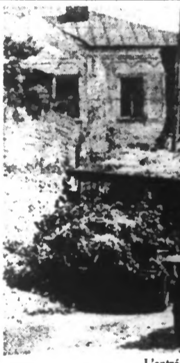
L'entrée des troupes allemandes à Voroneje.