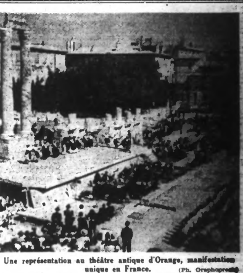
Une représentation au théâtre antique d'Orange, manifestation unique en France.