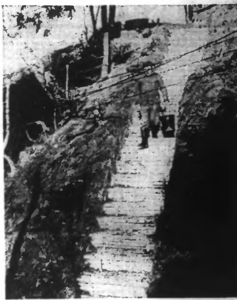
La corvée d'eau doit emprunter cet escalier plutôt raide qui mène à un poste, au sud-ouest du lac Ilmen.

Amsterdam, 6 décembre. - Le communiqué officiel du ministère de l'air britannique annonce qu'au cours de l'attaque exécutée le dimanche 6 décembre vers midi par des bombardiers et des chasseurs anglais contre le littoral de l'Ouest, douze bombardiers britanniques ont été abattus.