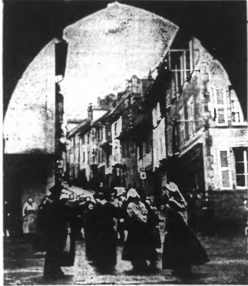
Des Auvergnats dansent la bourrée dans une rue du vieux village de Mur-de-Barrez, au cours d'une fête donnée au profit des prisonniers.

Une loi qui vient de paraître au « Journal officiel » interdit désormais toute augmentation du nombre des fonctionnaires, titulaires ou temporaires, et des agents recrutés sur contrat par les services de l'Etat et des collectivités ou organismes publics. Si tardive qu'elle soit, saluons cette décision dont la nécessité se faisait impérieusement sentir. Il n'est que logique qu'en contre-partie du nouvel effort exigé du contribuable, les services publics fassent preuve enfin de volonté d'économie. A en juger par l'importance du recrutement effectué depuis deux ans, il ne sera pas difficile aux administrations d'assurer leur mission sans nouveau personnel. Nous espérons donc que la volonté gouvernementale sera, pour une fois, strictement respectée et que les fins diplomatiques de nos services centraux ne mettront pas en œuvre de pénibles astuces pour tourner les règlements. Autrement, toutes ces dépenses passées sans nous laisser que peu sceptique. Au surplus, ne pas créer de nouveaux emplois serait bien, mais il paraîtrait encore mieux de procéder à des compressions. Certes, il ne s'agit pas de toucher aux fonctionnaires utiles, tels que ceux de l'enseignement, des douanes ou des P.T.T., mais il existe, par contre, de nombreux services où les grandes structures ne manquent pas. On pourrait sans dommage y pratiquer des coupes sèches et réaliser ainsi de massives économies. Cette mesure serait d'autant plus appréciée qu'elle réduirait le nombre des fonctionnaires. ROBERT KULLERZ.