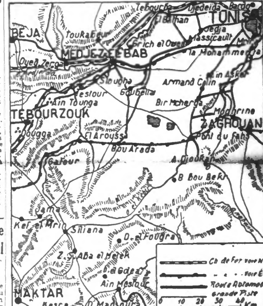
(Service cartographique du JOURNAL DE ROUBAIX.)

Dans le secteur sud du front de l'Est, les troupes allemandes ont repoussé l'ennemi qui s'efforçait d'effectuer des pertes sur toute la longueur du front, et lui a infligé de lourdes pertes. Nos troupes ont subi de graves pertes, mais ont résisté avec succès. Au cours de ces combats, une division blindée a, par une vigoureuse poussée, défilé un fort convoi ennemi. Les troupes allemandes qui mènent la guerre de mouvement dans le Caucase oriental, ont rompu systématiquement le contact avec l'ennemi. A la forte pression de l'ennemi une résistance acharnée qui opposent les troupes allemandes, ont permis de maintenir le contact avec l'ennemi. Près de Wolk-Luki, les bolchevistes ont perdu dix-cinq chars au combat. Au sud de la Ladoga, de violents combats soviétiques ont échoué devant la défense résolue de nos troupes. L'ennemi y a perdu quatorze chars de combat. Dans la grande boucle du Don et sur le cours moyen de ce fleuve, les combats continuent avec des avances et des reculs alternatifs. Dans le secteur central et au sud-est du lac Ilmen, des opérations locales de l'ennemi ont échoué. Près de Wolk-Luki, les bolchevistes ont perdu dix-cinq chars au combat. Au sud de la Ladoga, de violents combats soviétiques ont échoué devant la défense résolue de nos troupes. L'ennemi y a perdu quatorze chars de combat.