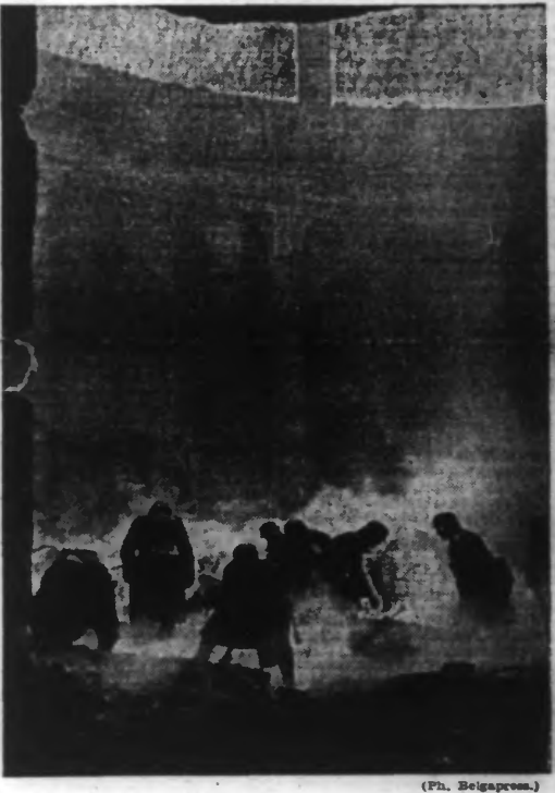
La cathédrale catholique de Berlin a été détruite par les honteux « exploits » de l'aviation britannique. — Le déblaiement des ruines