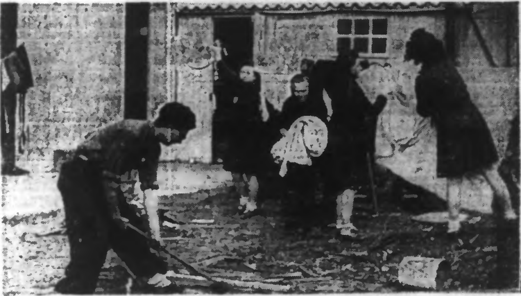
Une « Maison des Jeunes » a été créée à La Rochelle. Des jeunes gens et des jeunes filles viennent en aide gracieusement aux vieux ménages, aux familles nécessiteuses et aux sinistrés, comme le montre notre photographie. Chaque semaine, ils offrent un repas aux enfants de prisonniers.

Paris, 5 mars. — Le président Laval est arrivé vendredi après-midi, à Paris. Après être entré, avec l'ambassadeur d'Allemagne, dans le grand hall de l'Assemblée nationale, le gauleiter Sauckel, il a été reçu par les journalistes qui se trouvent actuellement réunis à Paris. Après un court discours, le gauleiter a prononcé une allocution dans un amphithéâtre de la Sorbonne. M. de Brinon, secrétaire d'Etat, délégué général du gouvernement dans les territoires occupés, et M. Abel Bonnard, ministre de l'Education nationale, avaient pris la parole devant les journalistes. « Il convient, a déclaré M. de Brinon, que les Français choisissent leur camp, qui ne peut être que celui de l'Europe libre et du gouvernement français. Mais ce choix, pour être efficace, doit s'accompagner non point seulement par des mots, mais par une démonstration de volonté française. »