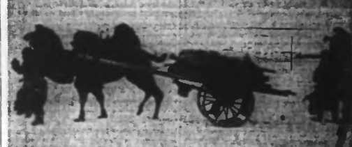
Des paysans russes du Caucase quittent leur village pour fuir la terreur bolcheviste.

Au sud du lac Ladoga, par suite des lourdes pertes qu'il a subies, l'ennemi a mené des attaques plus faibles que les jours précédents, auxquelles ont été déployés des renforts.