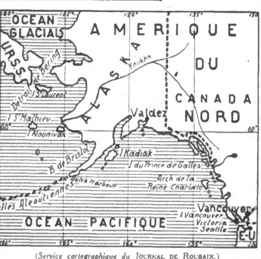
(Service cartographique du JOURNAL DE ROUBAIX.)

Tokio, 14 mai. — Le Quartier général impérial communique : Le 13 mai, des puissantes unités de troupes américaines ont débarqué dans l'île d'Attu, faisant partie du groupe des Aléoutiennes. De violents combats ont eu lieu avec les troupes d'occupation japonaises. L'île d'Attu est située à la pointe ouest de ce groupe et fut occupée par les Japonais en juin 1942. L'offensive japonaise en Chine centrale Tokio, 14 mai. — Les forces aériennes japonaises qui ont effectué une attaque sur Tchang Tou et Te Chan, points stratégiques de la région nord de guerre de la province de Hunan, le 13 mai, ont été repoussées par les troupes américaines et chinoises. Les avions japonais ont été complètement détruits. D'autre part, selon un communiqué de jeudi soir, les forces japonaises ont traversé le Yang Tse-Kiang, le plus grand fleuve de Chine, pour aller vers le port principal de Sou Tchang, port principal sur le fleuve. L'opération a été effectuée sous le couvert de l'artillerie et la protection des forces aériennes. Environ 40.000 Japonais prennent part à cette opération le long des côtes occidentales du Lac de Tchang Ting. D'autre part, selon un porte-parole militaire chinois, les Japonais cherchent actuellement à s'emparer de plus riches rizières du Hunan et à s'avancer vers les villes de Tsungking et de Kengyang, points stratégiques importants de la province sur la ligne de chemin de fer de Canton à Hankou.