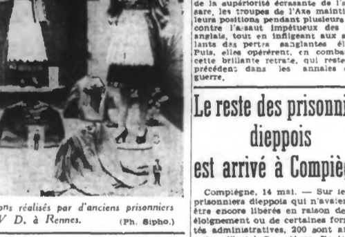
Une exposition de costumes bretons réalisés par d'anciens prisonniers de l'Oflag IV D, à Rennes.

L'ANGLETERRE elle aussi, se défend contre l'invasion juive Genève, 14 mai. — La revue américaine « Times » relate une prise de position significative des Anglais vis-à-vis du problème juif. Une députation juive à laquelle appartenait le cardinal Hinesley, s'était présentée chez M. Morrison, ministre de l'Intérieur anglais, et avait prié d'accueillir 200 enfants juifs d'Europe en Angleterre. M. Morrison a répondu que seuls les enfants juifs qui ont de proches parents en Angleterre, environ 250 sur les 2.000, étaient admis à fouler le sol britannique. Selon le « Times », le ministre aurait ajouté : « Si les autres enfants juifs recevaient également l'autorisation de débarquer, ce serait en fait l'équivalent d'une prise de position en faveur de l'antisémitisme en Angleterre. »