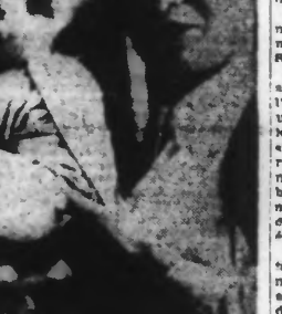
M. Bastianini dit la ferme volonté du peuple italien de ne pas se laisser abattre par un ennemi qui veut l'asservir

Les bases russes seront-elles demandées à Staline pour une offensive contre le Japon? Amsterdam, 20 mai. — L'agence Reuters souligne, dans le discours de M. Churchill, que l'Union soviétique a été engagée à poursuivre la guerre jusqu'à la destruction complète du Japon.