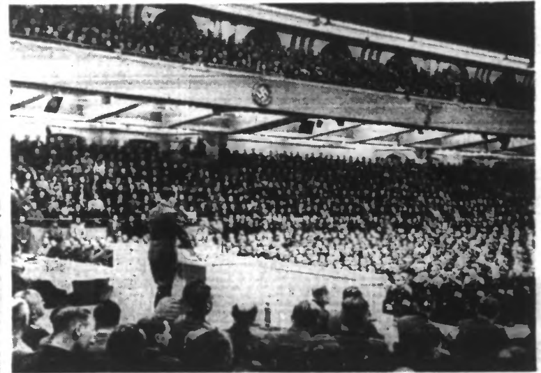
Au Palais des sports de Berlin, samedi, pendant le discours de M. Speer, ministre de l'Armement, sur les statistiques de la production de guerre allemande.

La construction des tanks et des armes lourdes attendrait, d'autre part, une cadence inégalable.