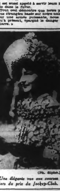
Une diapositive vue aux courses lors du prix du Jockey-Club.

« Elle a toujours été la doctrine du Vatican à l'égard du bolchevisme, et une déclaration officielle publiée par le journal catholique « l'Italia » tendait naturellement à démontrer que des négociations n'ont pu être ouvertes avec Moscou depuis la dissolution du Komintern en vue de la signature d'un accord ».