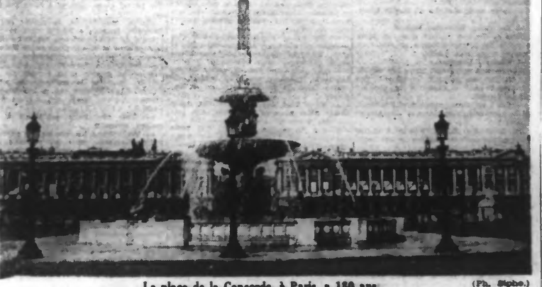
La place de la Concorde, à Paris, à 180 ans. C'est en 1763 que l'architecte Gabriel a construit, avec la place de la Concorde, les magnifiques hôtels qui sont l'hôtel Grillon et le ministère de la marine.