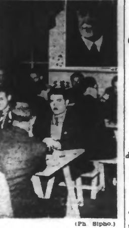
Des prisonniers libérés reçus au centre d'accueil de la rue du Paradis, à Paris, photographiés pendant le déjeuner qui leur a été offert.

QUARTIER GÉNÉRAL DU FÉHRER, 15 JUIN. — Le haut commandement de la Wehrmacht communique : Au cours d'une reconnaissance offensive au-dessus de l'Atlantique, des avions de combat allemands ont gravement endommagé un cargo, au large de la côte portugaise, et ont descendu en combat aérien quatre appareils ennemis. La nuit de lundi à mardi, des bombardiers britanniques ont survolé l'océan de l'Atlantique. La population de la ville d'Oberhausen a subi des pertes par les bombes. Des destructions considérables ont été causées, surtout dans les quartiers habités. Selon les constatations faites jusqu'ici, vingt bombardiers ont été abattus. Dans la nuit du 14 au 15 juin, la Luftwaffe a attaqué, à coups de bombes de calibre lourd, des objectifs isolés dans le secteur de Londres et des îles de l'Angleterre. Selon les informations complémentaires dont on dispose maintenant, huit bombardiers et avions torpilleurs ont été abattus au cours d'une attaque menée par une formation aérienne ennemie sur un convoi allemand, au large de la côte portugaise, le 14 juin. Une de nos unités, dont la plupart des membres de l'équipage ont pu être sauvés, a coulé.