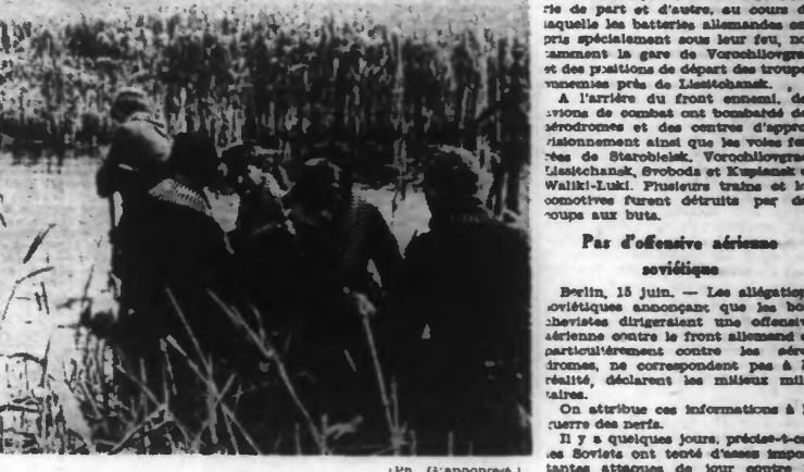
Un groupe de soldats allemands, franchissant un marais dans la lagune du Kouban, sonde le terrain avant de s'aventurer dans l'eau.

QUARTIER GÉNÉRAL DU FÉHRER, 15 JUIN. — Le haut commandement de la Wehrmacht communique : Au nord du Kouban et dans le secteur de Belev, des attaques ennemies d'importance locale ont échoué.