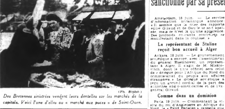
Des Bretonnes sinitrées vendent leurs dentelles sur les marchés de la capitale. Voici l'une d'elles au « marché aux puces » de Saint-Ouen.

Vichy, 19 juin. — Le Conseil des ministres se réunit aujourd'hui à 10 h. sous la présidence du maréchal Pétain. Le président Laval fera un exposé sur la situation extérieure et M. Max Bonafant rendra compte des conditions dans lesquelles s'effectue la soudure.