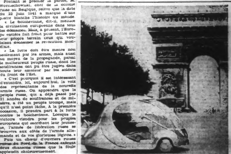
L'ÉCLAIR électrique est un nouveau véhicule qui vient de faire son apparition à Paris. Il pèse 300 kilos et peut parcourir 120 kilomètres. à une vitesse de 75 kilomètres à l'heure.