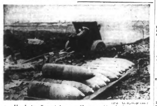
Un obusier allemand de gros calibre en position de tir.

Madrid, 27 juin. — Une dépêche de Mexico annonce que M. Umansky, ministre soviétique au Mexique, a déclaré au cours d'une interview que l'Union soviétique géométrait avec « opiniâtreté » la création d'un second front en Europe.