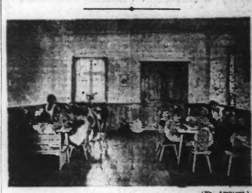
Une garderie d'enfants comme il y en a des milliers dans le Reich.

Dans un premier article, nous avons décrit les impressions que nous a laissées la visite de nombreuses maisons de repos pour jeunes mères, de garderies d'enfants, etc.