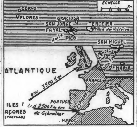
(Service cartographique du JOURNAL DE ROUBAIX.)

Tokio, 12 octobre. — L'agence Domei annonce que les Japonais ont attaqué à deux reprises, dans la nuit du 10 au 11 octobre, les installations portuaires et les objectifs militaires de Lissabon. En dépit de la violente réaction de la D.G.A., les aviateurs nippons provoquent des incendies et des explosions en cinq endroits. Tous les avions ayant pris part à ce raid sont rentrés sans encombre à leurs bases. Pendant la même nuit, une autre formation nipponne a repéré un convoi ennemi naviguant au large de Cretin Point et a gravement endommagé un transport de moyen tonnage. Les Nippons n'ont subi aucune perte. Tokio, 12 octobre. — Au cours d'un raid exécuté par l'aviation ennemie sur la localité de Elevation, dans l'île de Bougainville, la défense nipponne a abattu 11 des 21 appareils qui comportaient une formation adverse qui lui fut opposée. La famine qui sévit au Bengale est évitée Amsterdam, 12 octobre. — Le ministre des Indes, Amery, annonce l'agence d'Informations britanniques que le gouvernement indien a déclaré la loi sur la production de riz dans la crise d'alimentation dans la province du Bengale. M. Amery a déclaré que toute autre question de navigation qui devait être jugée en tenant compte de tous les autres besoins urgents des Alliés. Dans le règlement de la situation du gouvernement central, a dit M. Amery, s'est heurté à la situation des provinces productrices, ce qui élevant des doutes au sujet du mode de répartition. Quelque le gouvernement ne