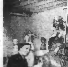
La religion, sujet d'un statutaire Guenet, et destiné à l'église Saint-Merri, à Paris.

Plus de subventions gouvernementales aux Etats-Unis pour abaisser le cout de la vie Washington, 24 novembre. — On mande de Washington au service d'informations britanniques que le Congrès américain a adopté le projet de loi qui prévoit la suppression des subventions gouvernementales en vue d'abaisser le cout de la vie. Le projet interdirait le paiement de subventions après le 31 décembre 1943. Il a été transmis au Sénat.