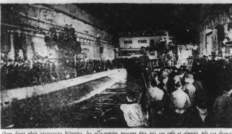
Dans leurs abris souterrains bétonnés, les sous-marins peuvent être mis sur cale et réparés, tels ces deux-ci, prêts de nouveau à appareiller.

QUARTIER GÉNÉRAL DU FUHRER, 24 NOVEMBRE. — Le haut commandement des forces armées communique : Sur la tête de pont de Nikolop, dans la grande boucle du Dnieper et près de Tcheriakov, de nouvelles et puissantes attaques soviétiques ont été repoussées après de durs combats. Des forces ennemies qui étaient initialement dans des positions furent anéanties ou rejetées en contre-attaques. Dans le secteur au sud de Kremenetsch, les Soviétiques continuèrent à faire du feu, au sud-est de Tcheriakov, plusieurs camps fortifiés de partisans ont été anéantis. Dans la région à l'est de Kiev, une attaque allemande de grande envergure a abouti à l'encercllement de puissantes formations ennemies. Dans ce secteur, une division blindée allemande a détruit ou capturé hier 30 chars, six batteries et quarante canons de tous calibres et a ramené des prisonniers dans ses lignes. Dans la zone d'infiltration à l'ouest de Gomel, les violents combats se sont encore poursuivis. Nos troupes ont opposé une résistance opiniâtre aux formations ennemies en progression. Au nord de Gomel, de fortes attaques ont été repoussées. Dans l'espace d'interdiction au sud-ouest de Kitchev, de vifs combats ont eu cours. Au nord-ouest de Nevel, une contre-attaque nous a fait reconquérir du terrain.