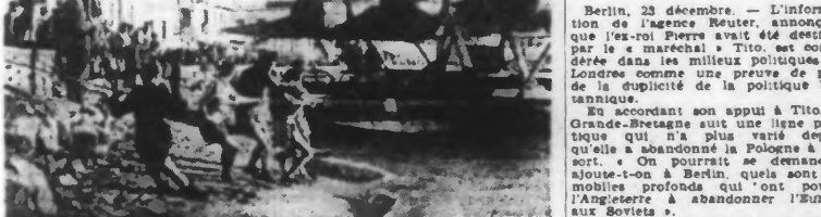
Un hydravion halé sur le rivage et qui sert au transport de blessés au-dessus de la mer Egée.