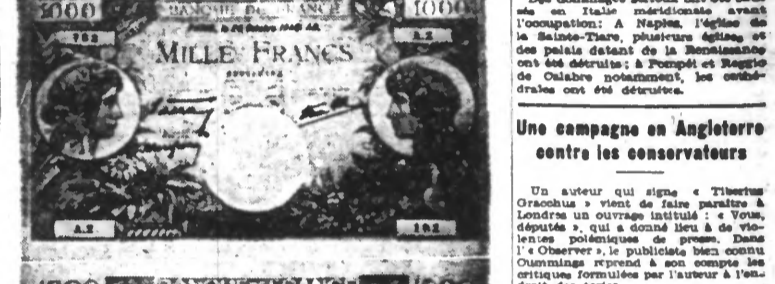
Le nouveau billet de mille francs émis par la Banque de France.