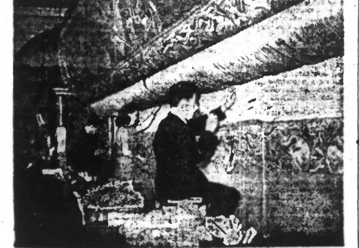
Travail de tapisserie aux ateliers des Gobelins.

Berlin, 30 août. — Le D.N.B. annonce que les pertes subies par les Soviétiques au cours de leur offensive d'été dans (Lire la suite page 4.)